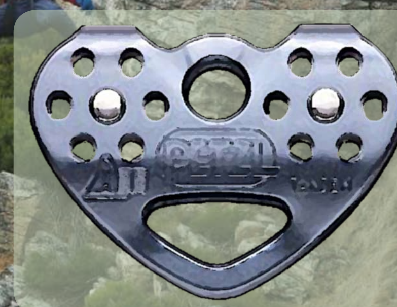
Poulie de type «TANDEM SPEED»